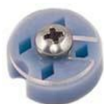
EM-Tec GB-4 クライオグリッドボックス 寸法: 14φ x 5.2mm スクリュー:M3x5mm.

The EM-Tec GB-4 クライオグリッドボックスは、クライオシステム試料のグリッド用に使用されます。菱形の4個のグリッド収納タイプで、収納位置のインデックスと透明な蓋付きラウンドグリッドボックスです。透明な蓋には、収納したグリッドにアクセスするように回転できるスロットが付いています。蓋はステンレスのネジでケースに取付られています。GB-4 クライオグリッドボックスは多くのクライオシステム用に使用されています。